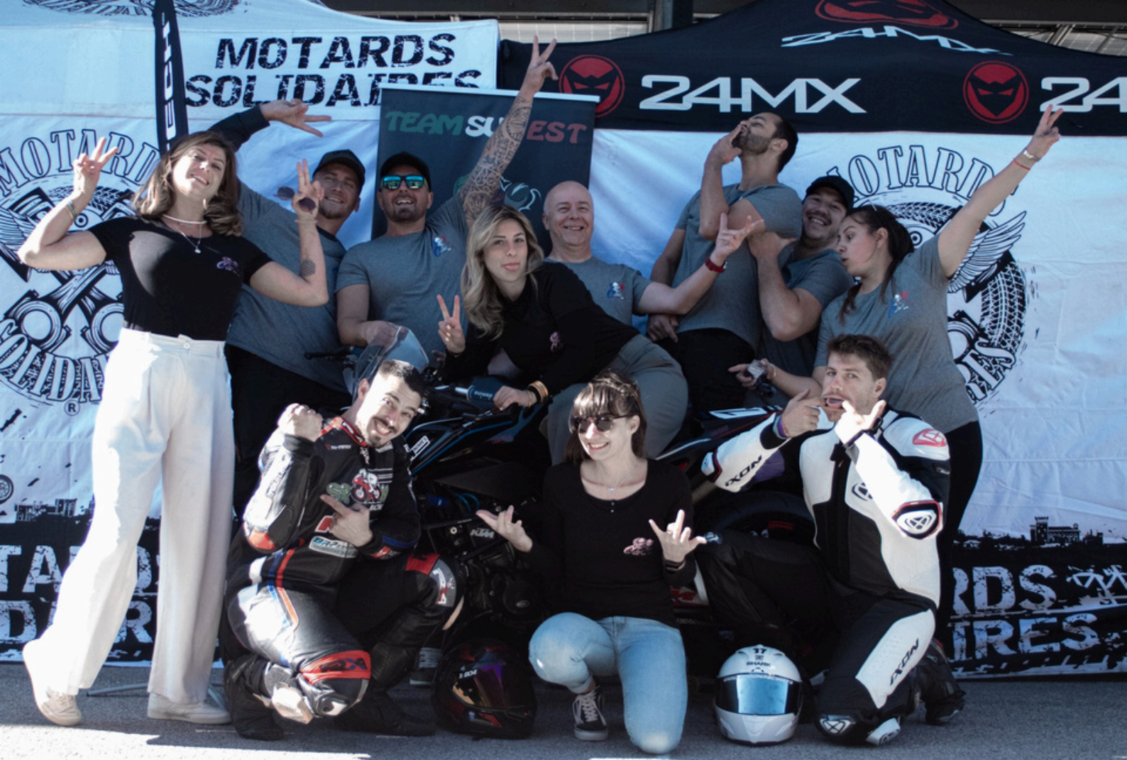
La Team Sud Est au bol d'argent 2024