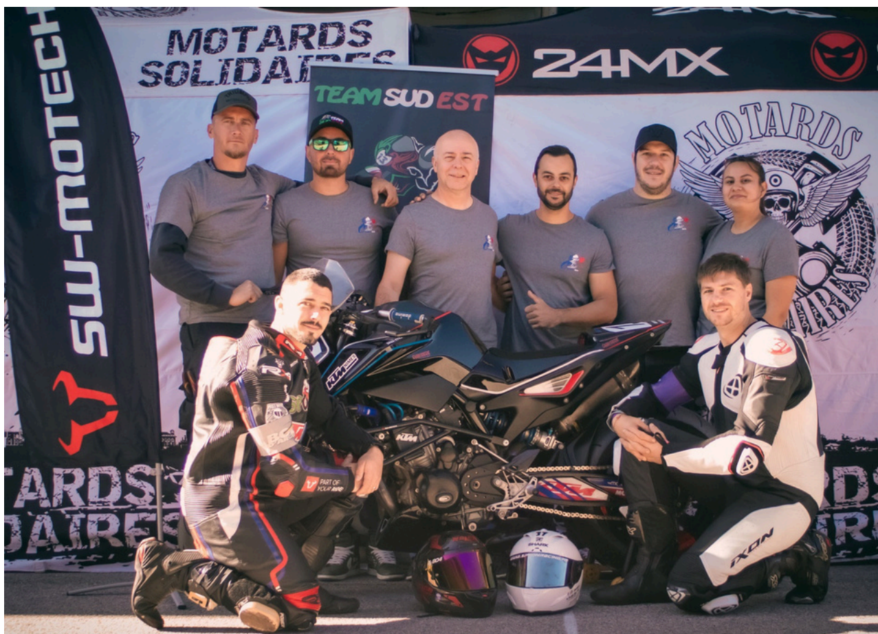
La Team Sud Est au bol d'argent 2024